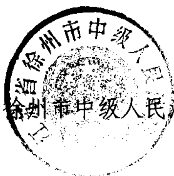
徐州市中级人民法院