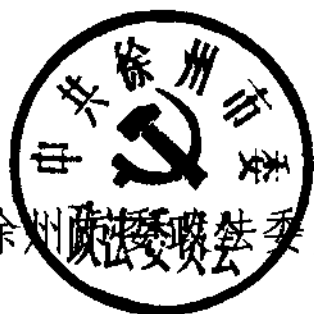
中共徐州政法委员会

三、立足本职，把观看影片与党的群众路线教育实践活动结合起来。 各单位要联系工作实际，把学习宣传詹红荔精神与贯彻落实党的十八大精神和开展党的群众路线教育实践活动相结合，立足本职做好工作，以饱满的热情、高昂的精神状态、扎实的工作作风，为全面深化改革推动“八项工程”取得更大成效，努力开创“两个率先”新局面提供有力保障。